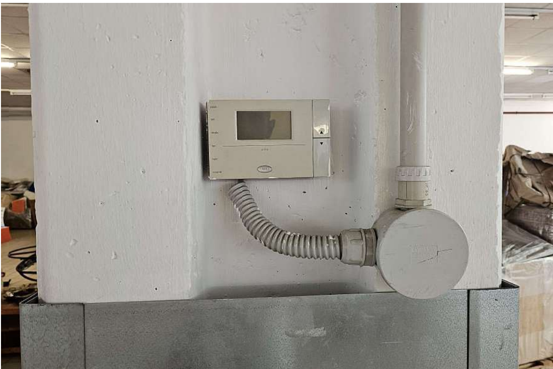
Termostato sistema di riscaldamento