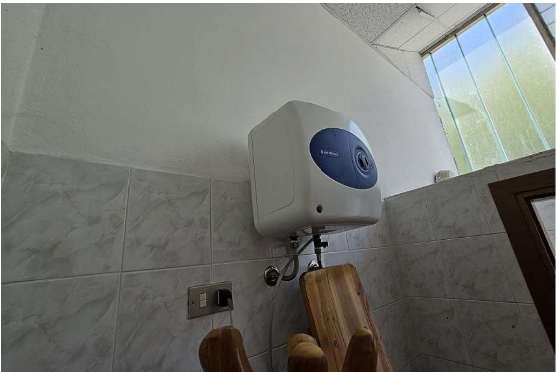
Boiler elettrico per la produzione di ACS