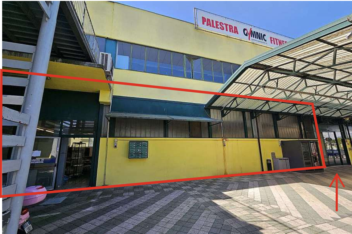
Esterno del Lotto 001 con indicazione dell'ingresso dal sub. 527