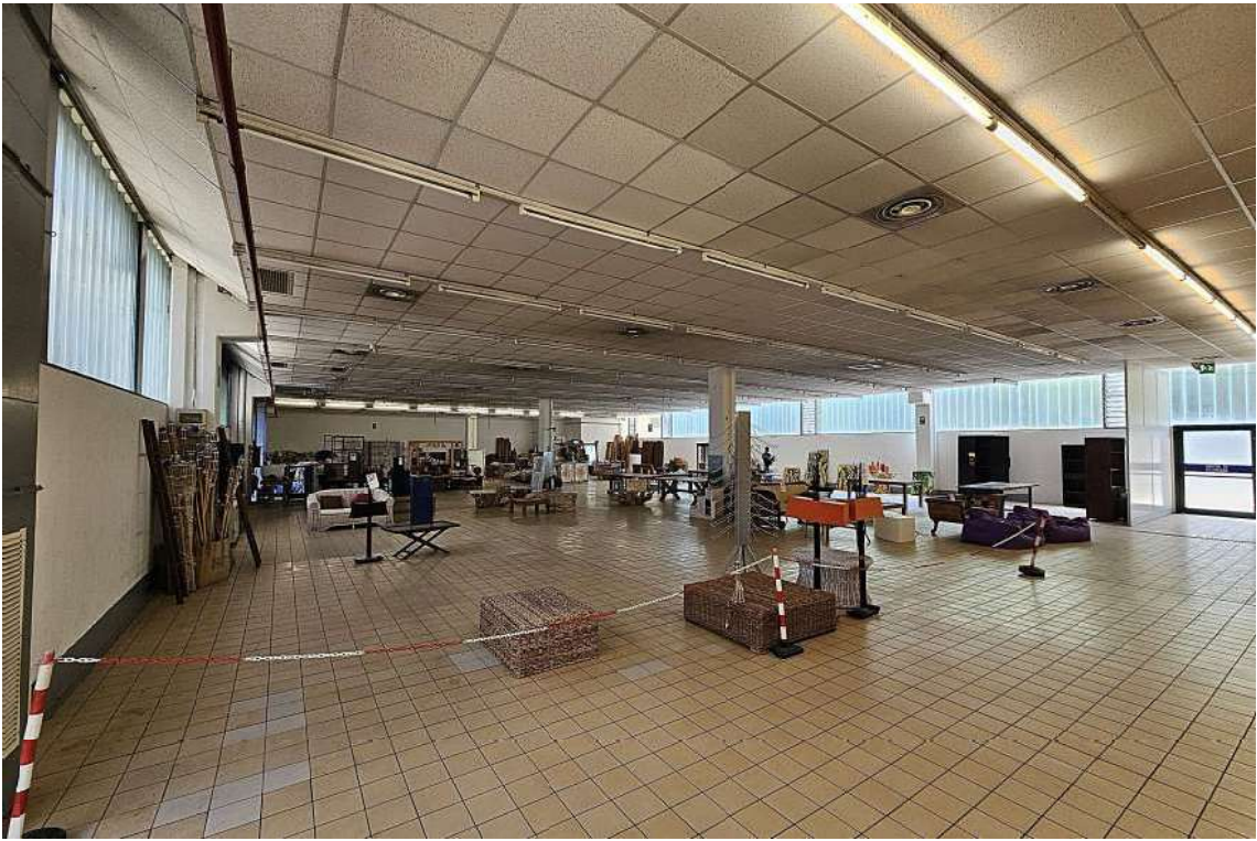
Area commerciale - vendita