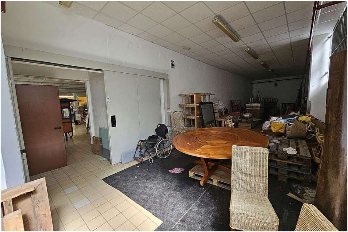
Magazzino posteriore all'area di vendita