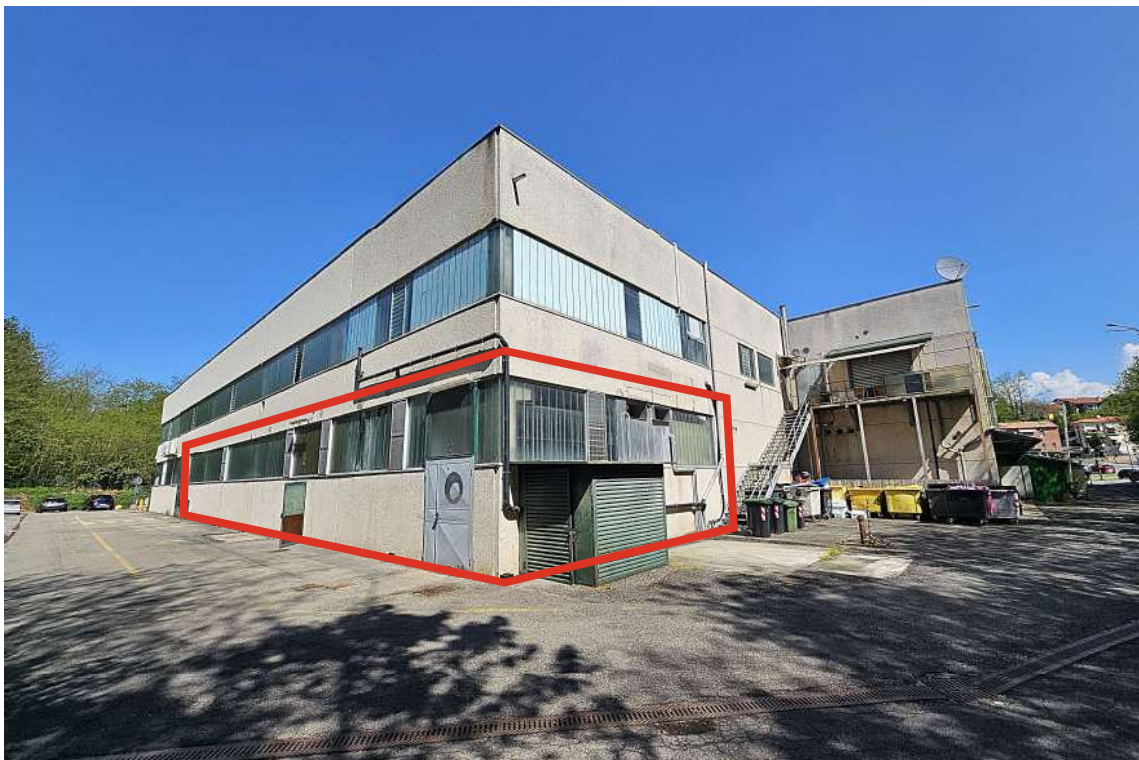
Retro dell'immobile al Lotto 001