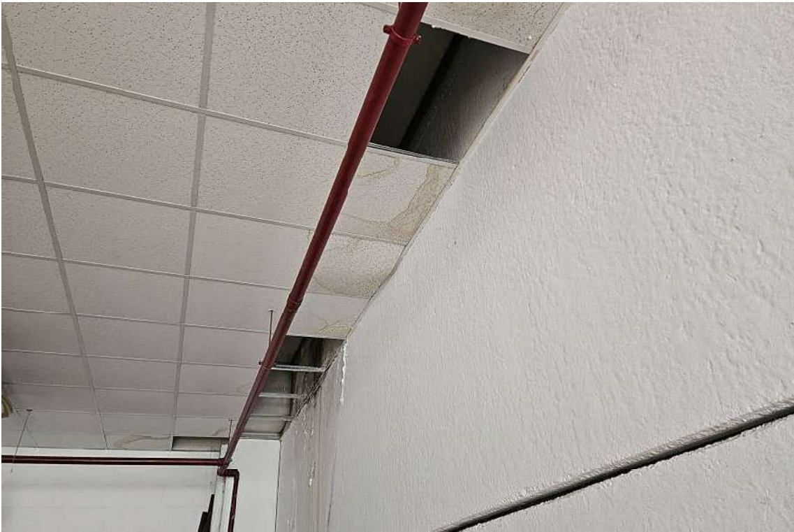
Perdita ora risolta dal soffitto