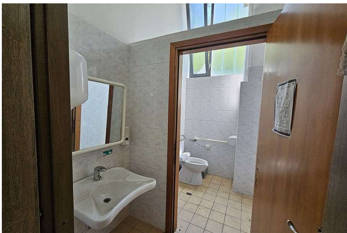
Bagno per disabili