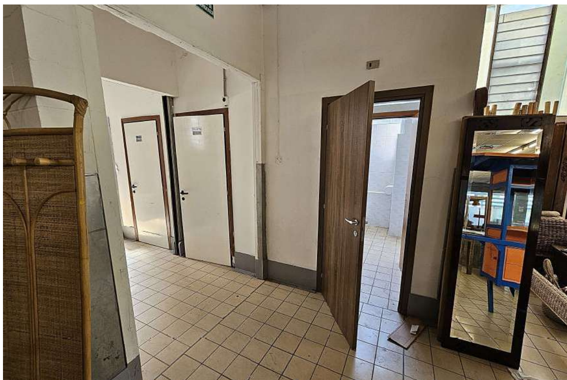
Accessi ai bagni