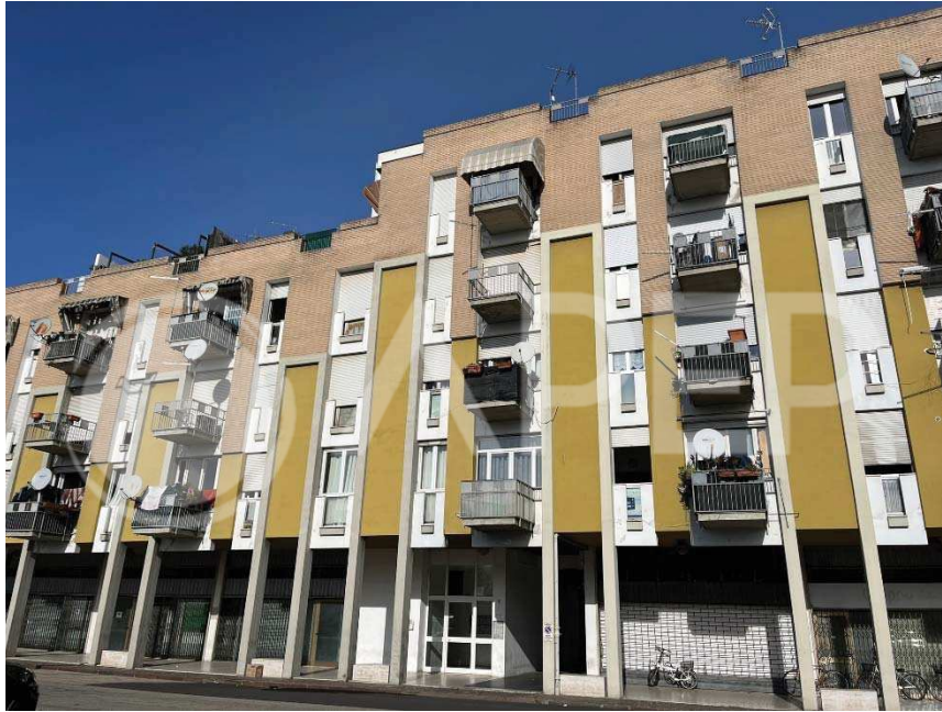
vista del fabbricato condominiale da Piazza del Mercato – lato sud