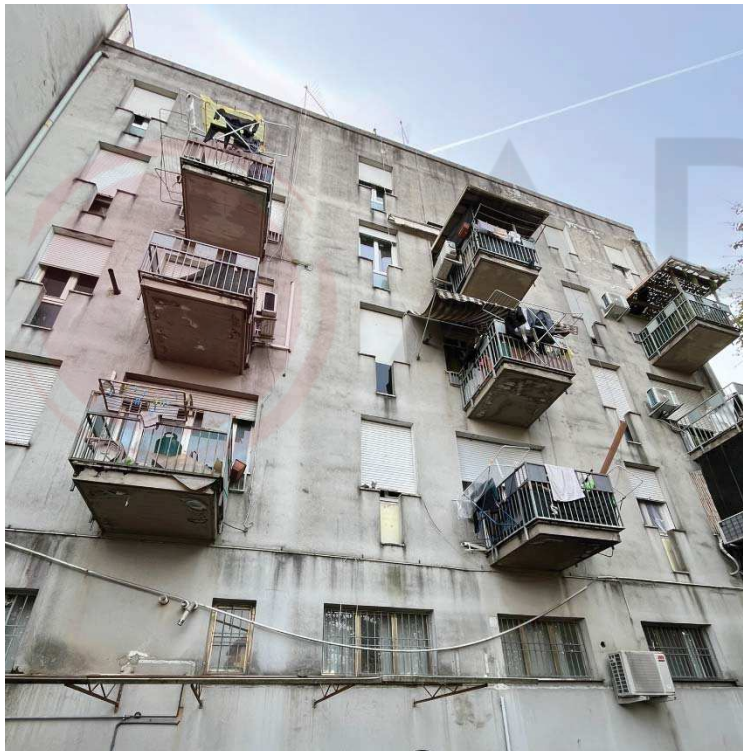
vista del fabbricato condominiale dal cortile interno – lato nord

Valutazione di mercato: la determinazione del più probabile valore di mercato del lotto pignorato è stata effettuata attraverso una comparazione sintetica del bene in oggetto con beni aventi le stesse caratteristiche tipologiche e/o costruttive e di finitura. Dai valori pubblicati dall’Agenzia del Territorio per il primo semestre dell’anno 2024, variabili fra 900 e 1200 €/mq per la tipologia Economica come quella in oggetto, si può