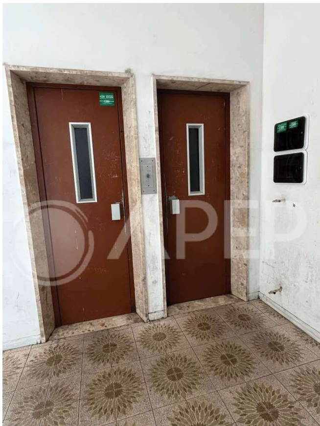
Foto 5 e 6 – vista degli ascensori e della porta di accesso all'abitazione