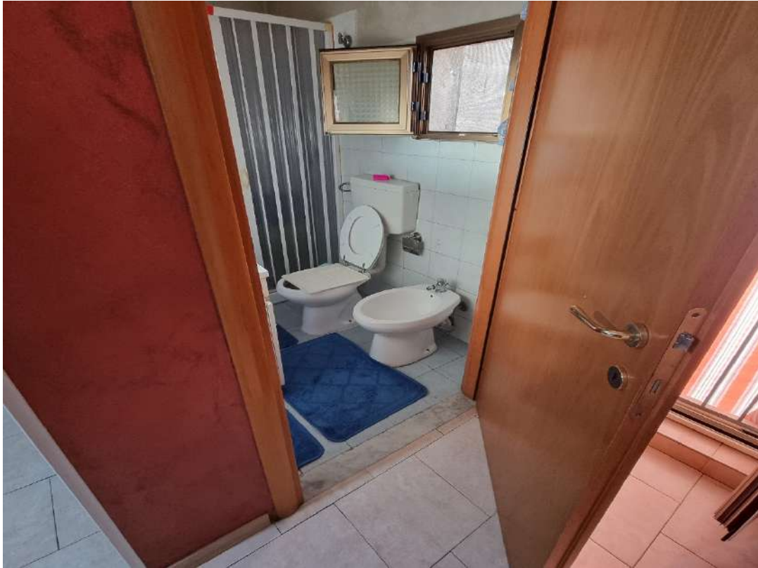
20241021_172048 - 2° Piano – W.C.