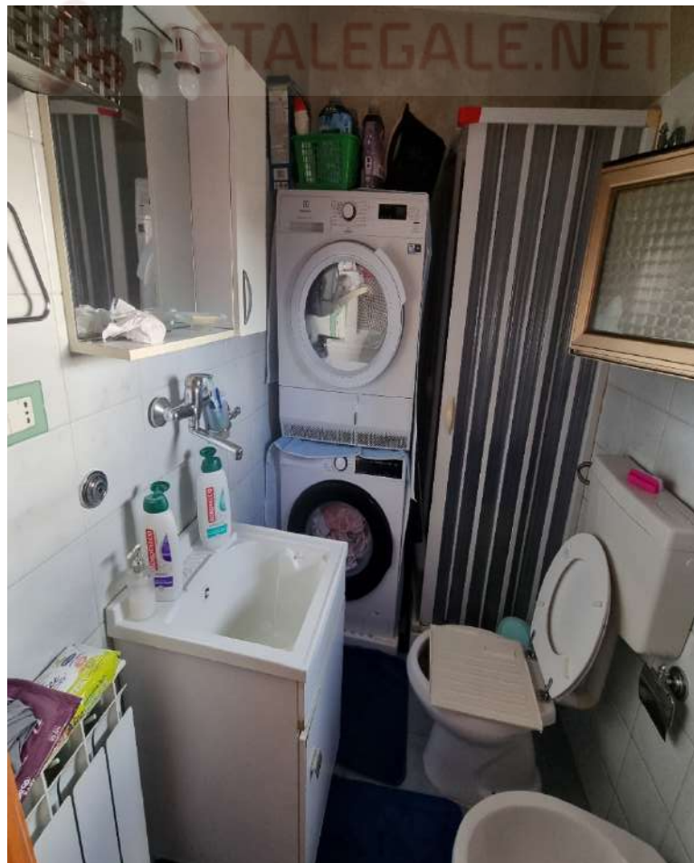
20241021_172054 - 2° Piano – W.C.