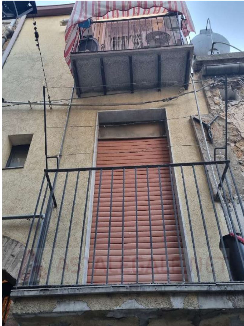
20241021_175351 – Prospetto di Via Roccabianca