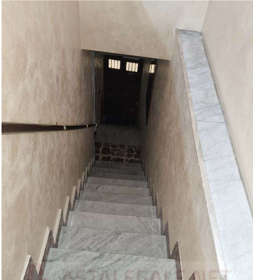
20241021_172002 – Vano scala tra 1° e 2° piano