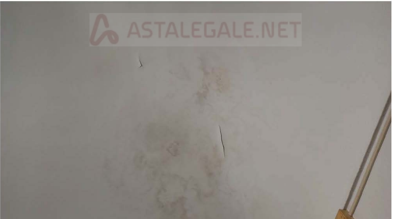
Tracce di umidità