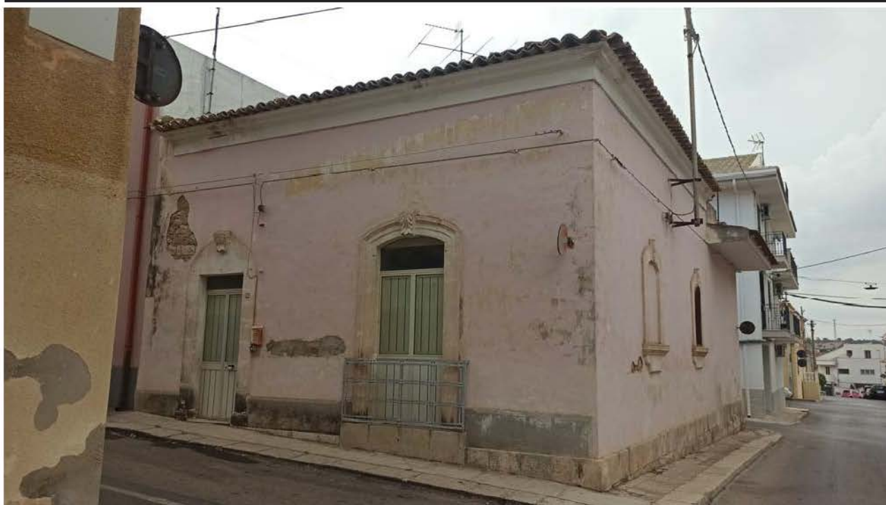
Prospetto su via C. Colombo