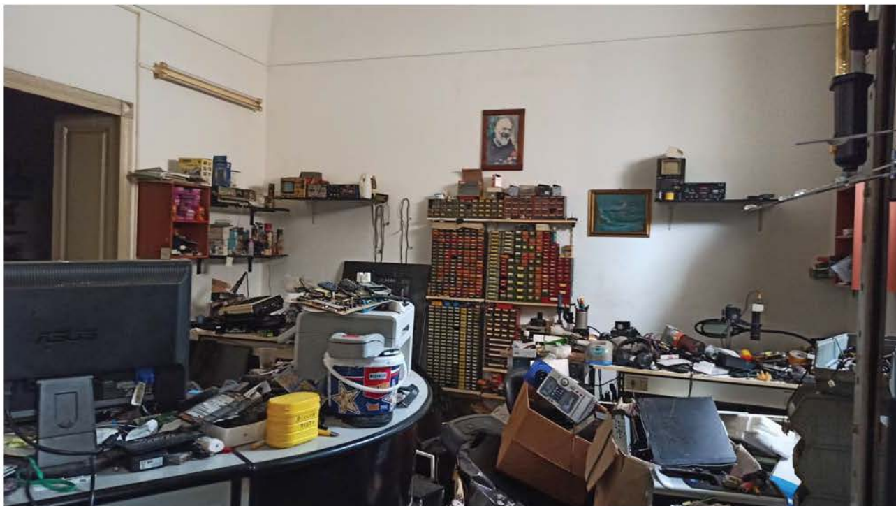
Seconda camera immobile via C. Colombo