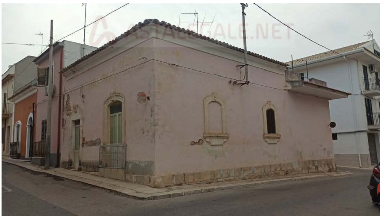
Prospetto su via V. Veneto