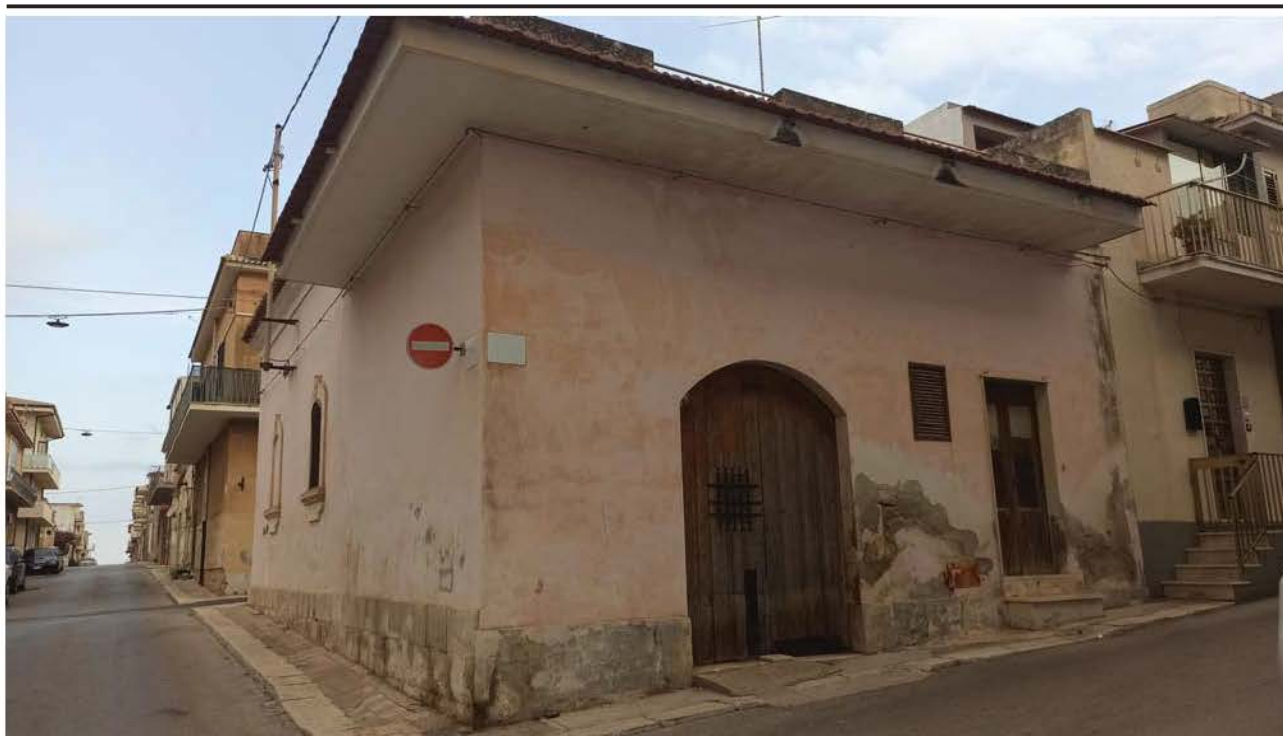
Prospetto su via G. Garibaldi