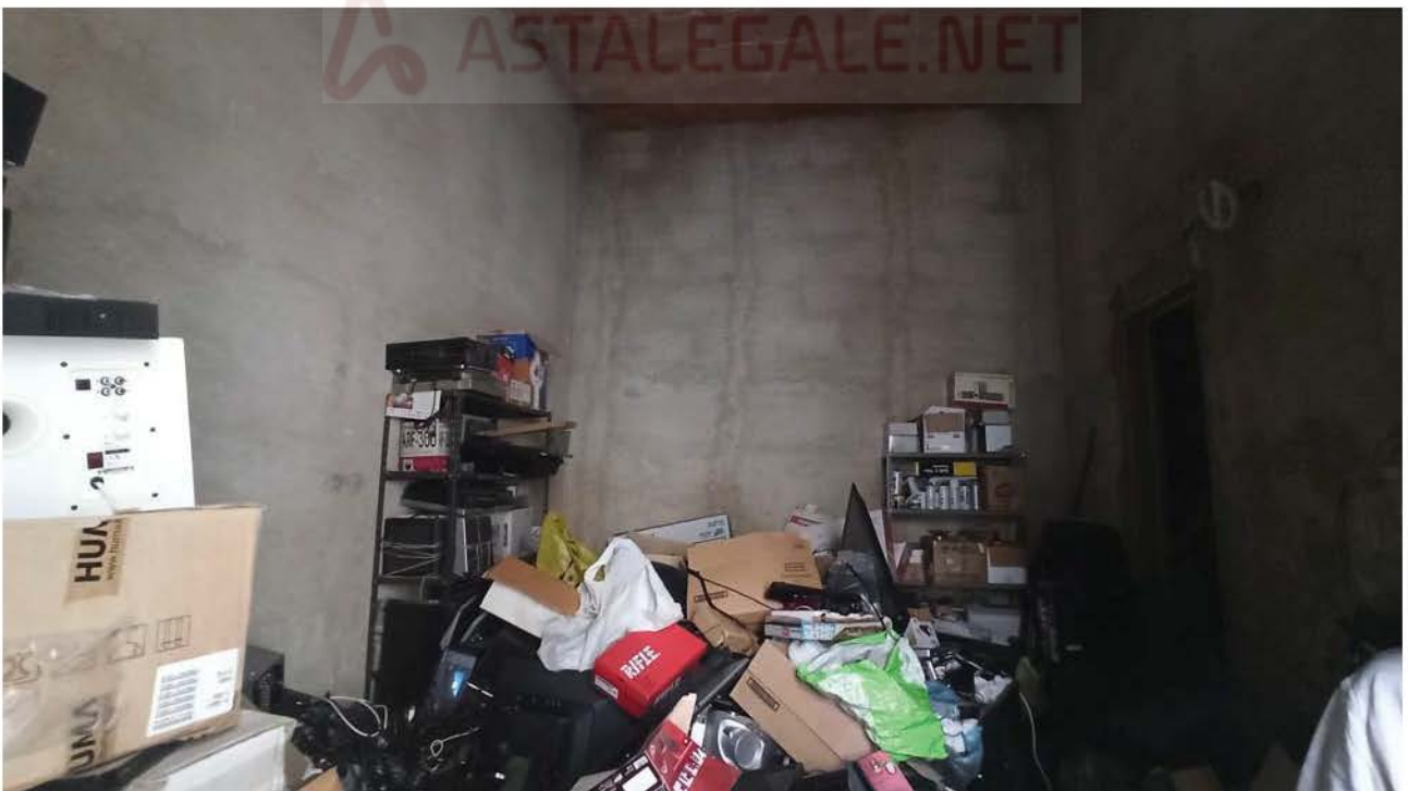
Immobile su via G. Garibaldi