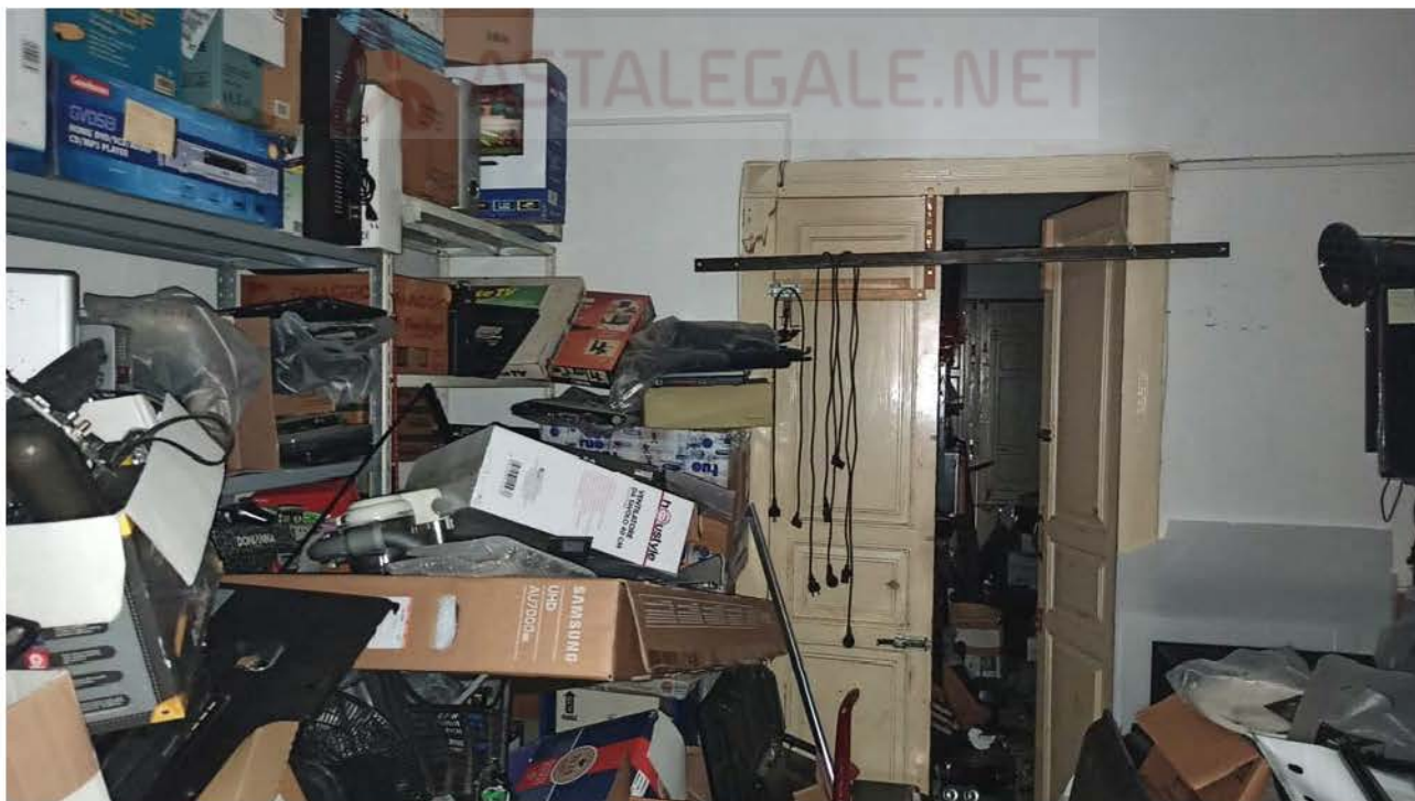
Terza camera immobile via C. Colombo