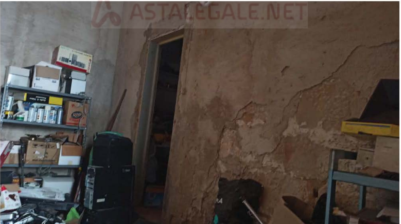
Stato di conservazione immobile su via G. Garibaldi