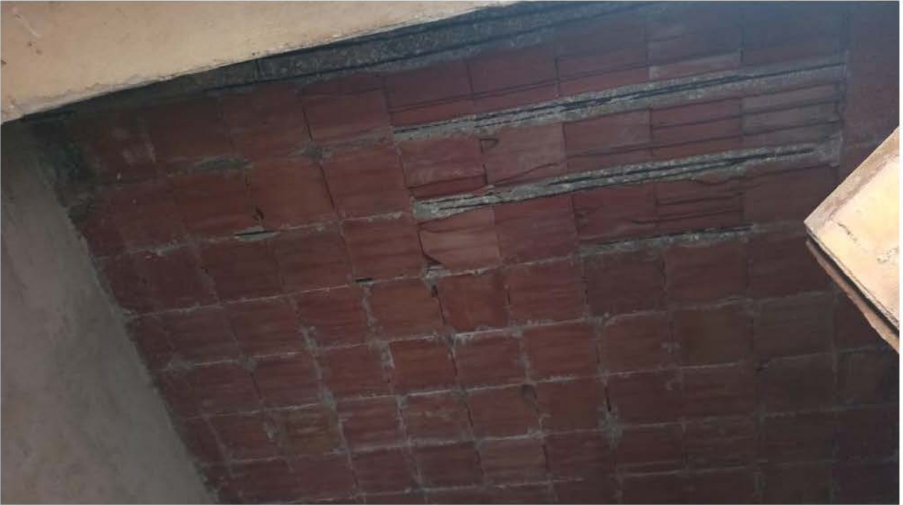
Soffitto immobile su via G. Garibaldi