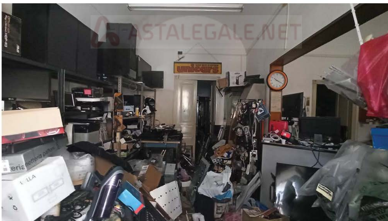
Prima camera immobile via C. Colombo