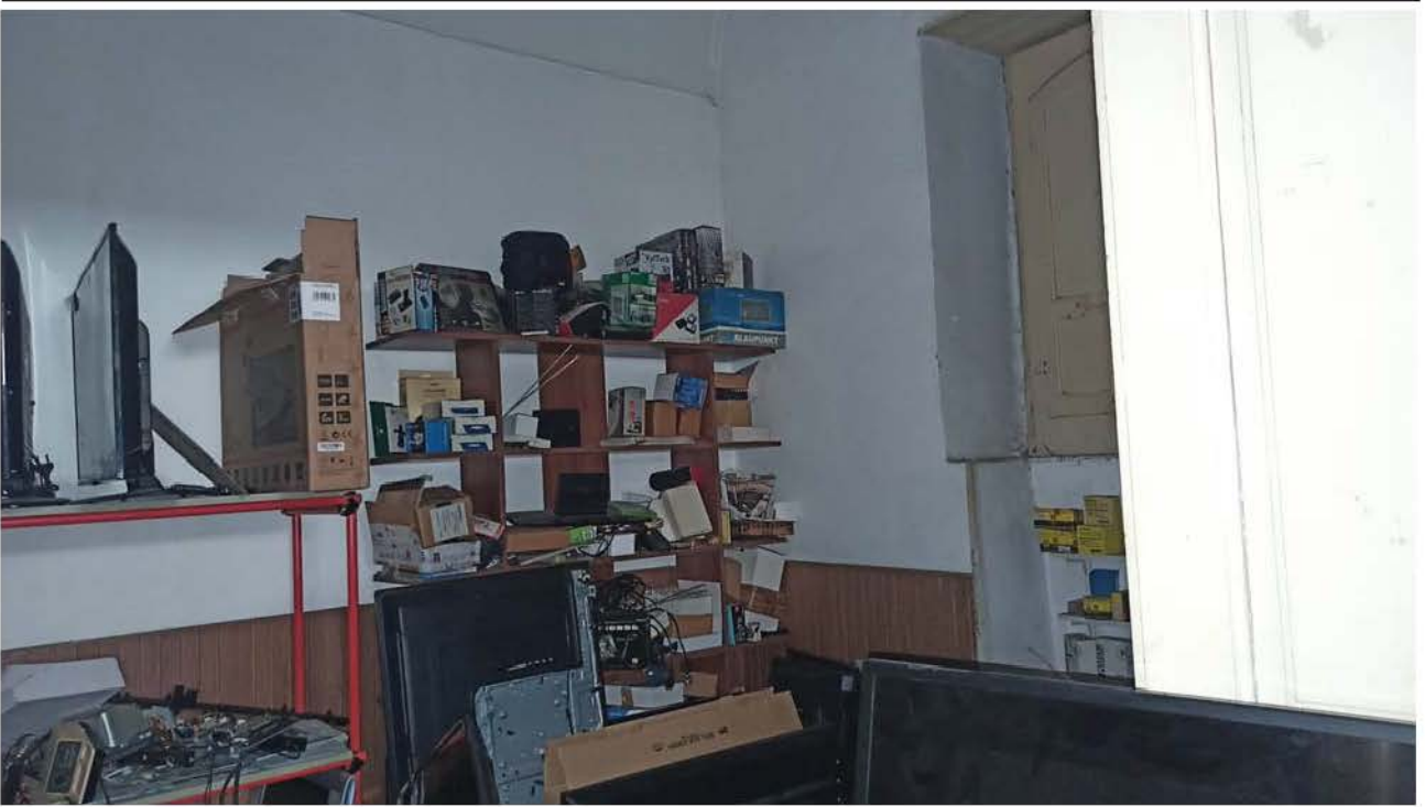
Quarta camera immobile via C. Colombo