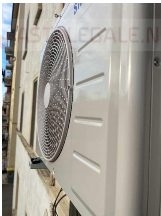
Lotto 1 – unità esterna condizionatore