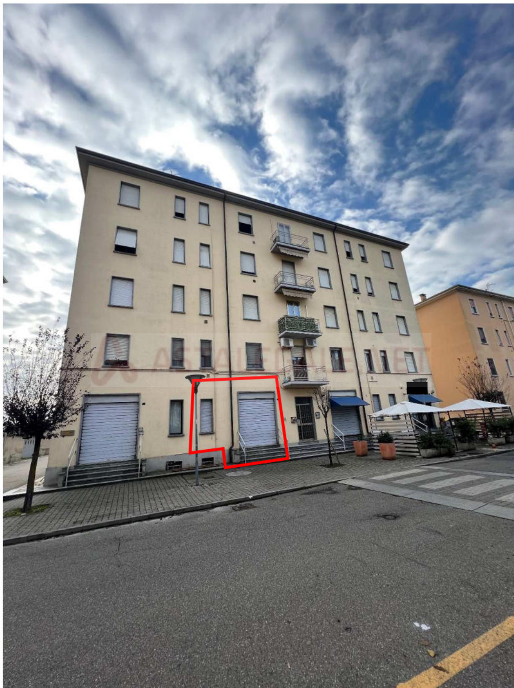
Lotto 2 – vista esterna da Via Marconi