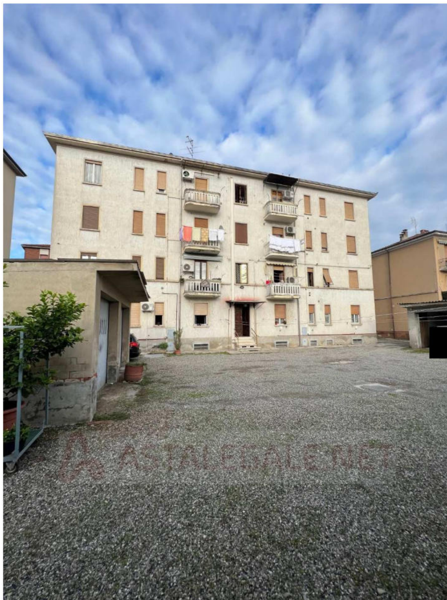
Lotto 1 – Vista esterna da retro