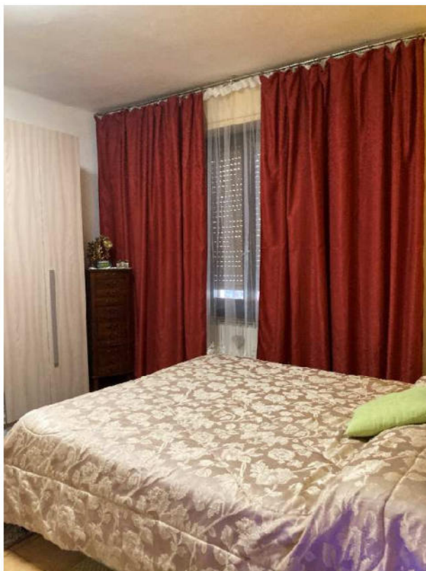
Lotto 1 – camera da letto