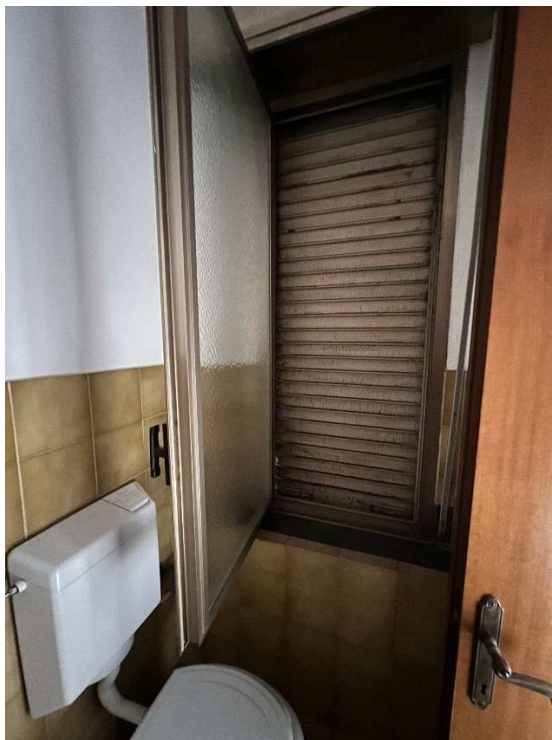
Lotto 2 – vista interna servizio igienico