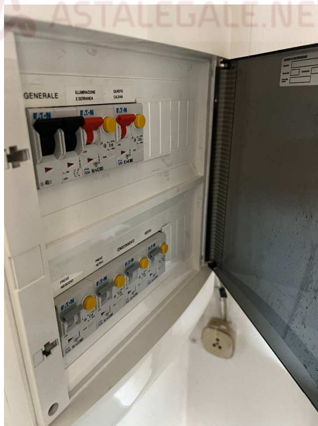
Lotto 2 –vista interna quadri elettrici