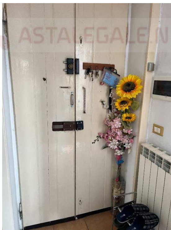
Lotto 1 – porta di ingresso