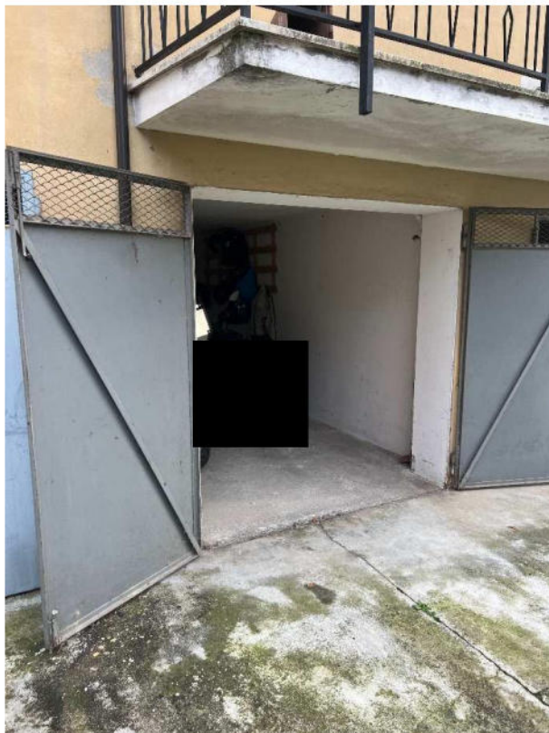
Lotto 4 –vista esterna autorimessa