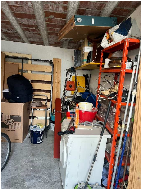
Lotto 1 – autorimessa