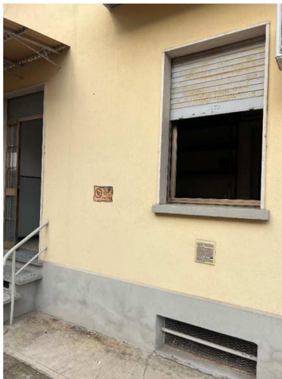
Lotto 2 – vista esterna dal retro