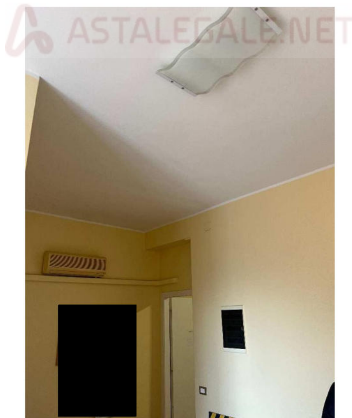
Lotto 3 –vista interna sala d’attesa