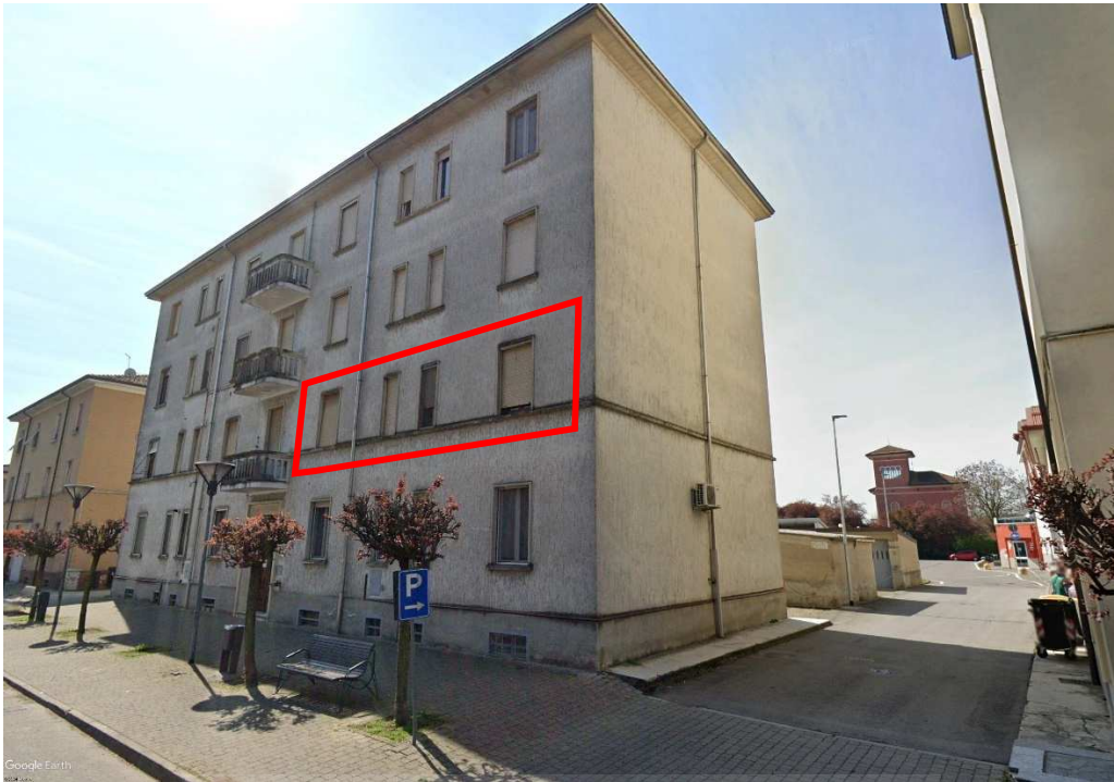
Lotto 1 – Vista da Via Marconi

APPARTAMENTO E AUTORIMESSA, P.PRIMO VIA G. MARCONI N.52 PONTENURE