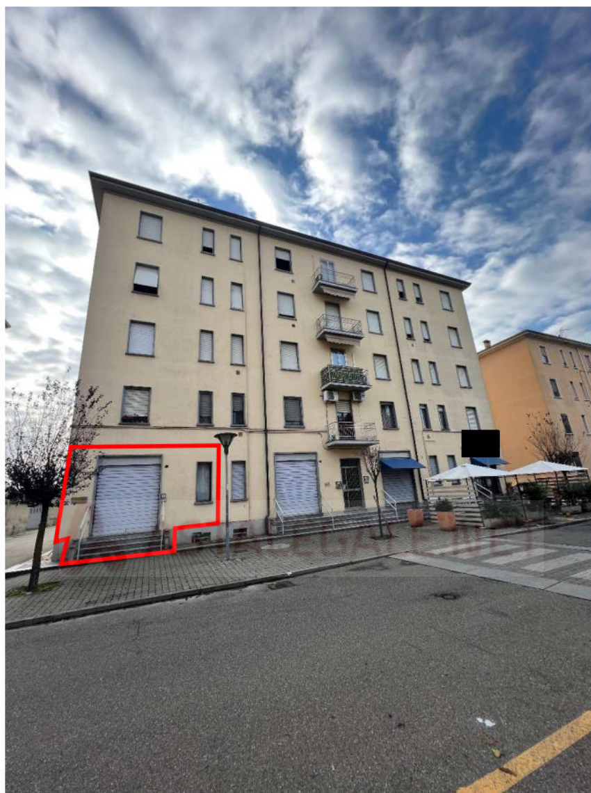
Lotto 3 –vista esterna lato strada