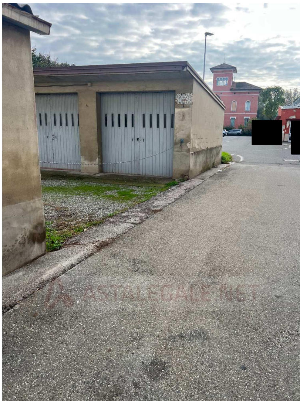
Lotto 1 – autorimessa