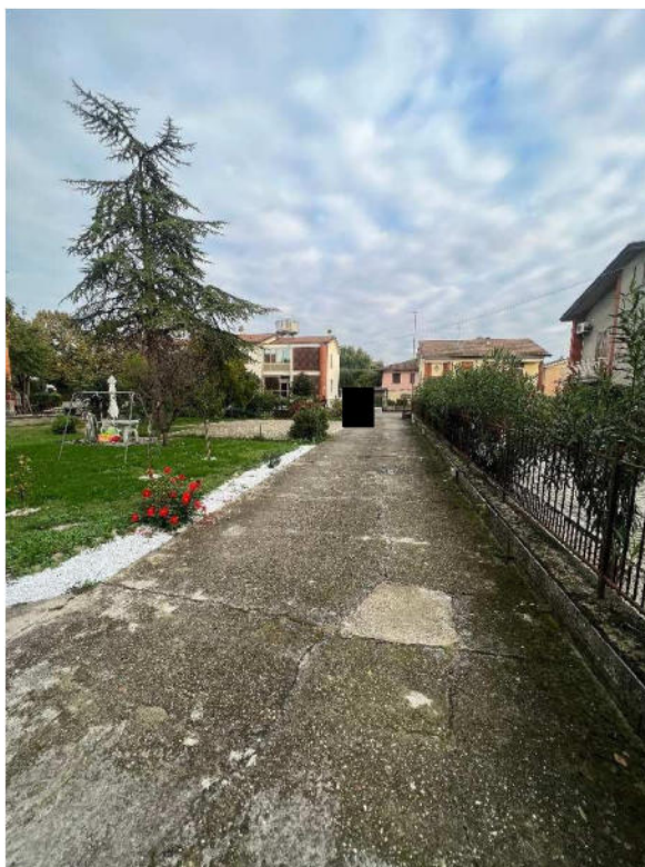
Lotto 4 –vista esterna stradello di accesso