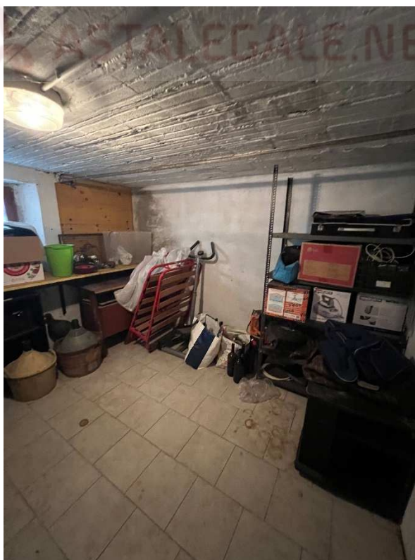
Lotto 1 – cantina