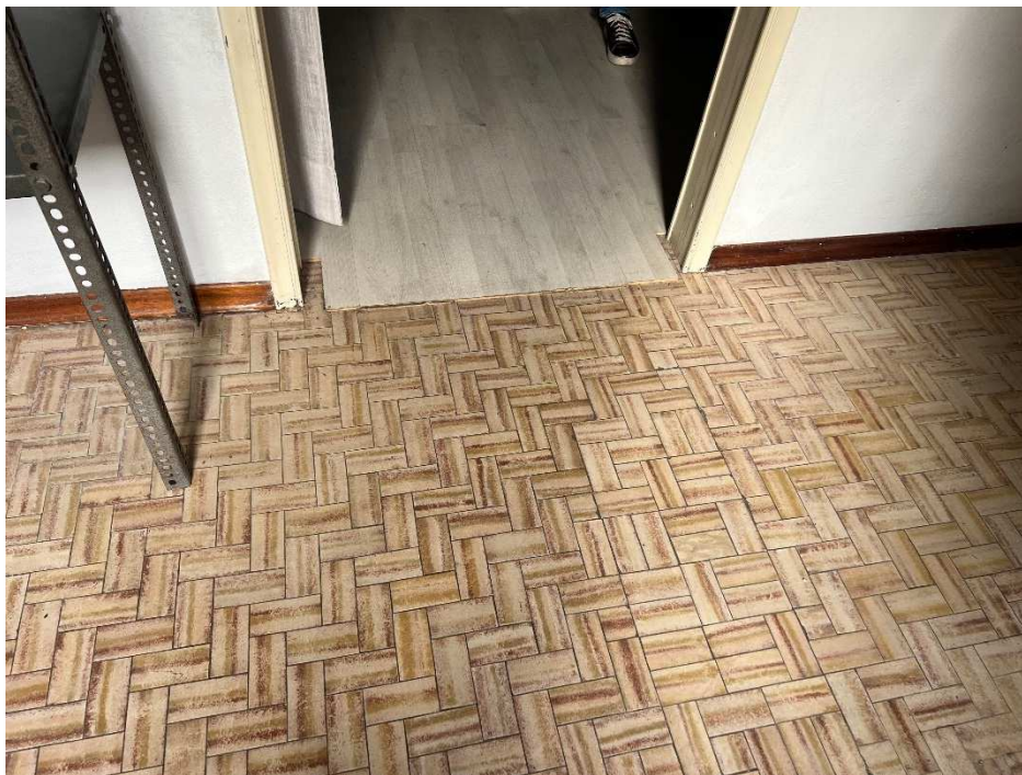
Lotto 2 –vista interna pavimentazioni