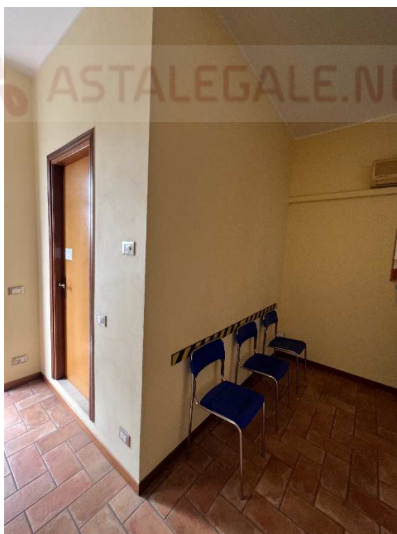
Lotto 3 –vista interna sala d'attesa