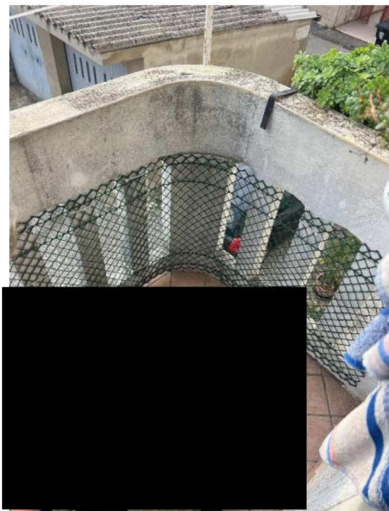
Lotto 1 – zona giorno