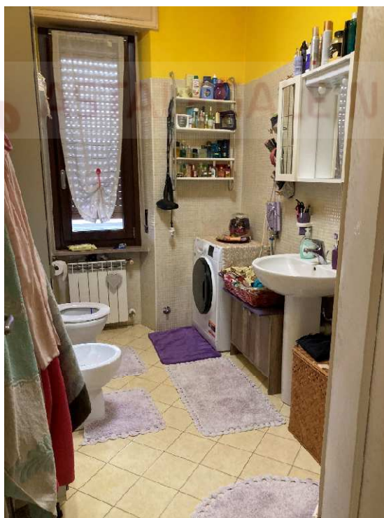
Lotto 1 – servizio igienico