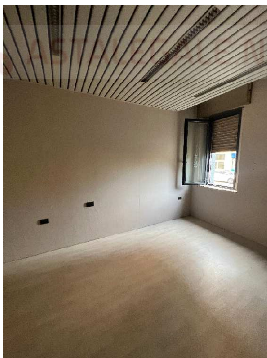
Lotto 2 –negoziato vista interna