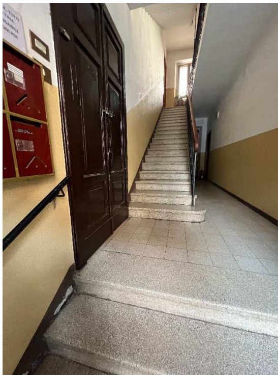
Lotto 1 – Vista vano scala condominiale