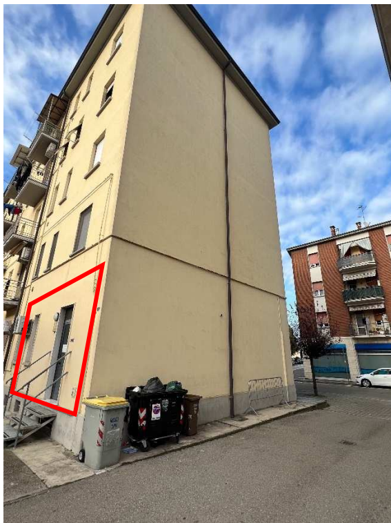
Lotto 3 –vista esterna retro e laterale