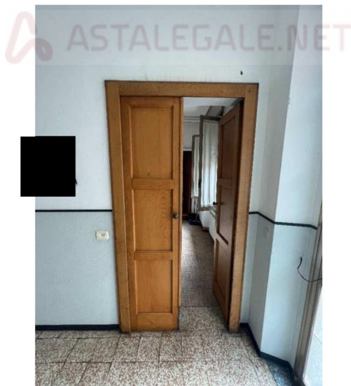
Lotto 2 – porta di ingresso da vano scala condominiale