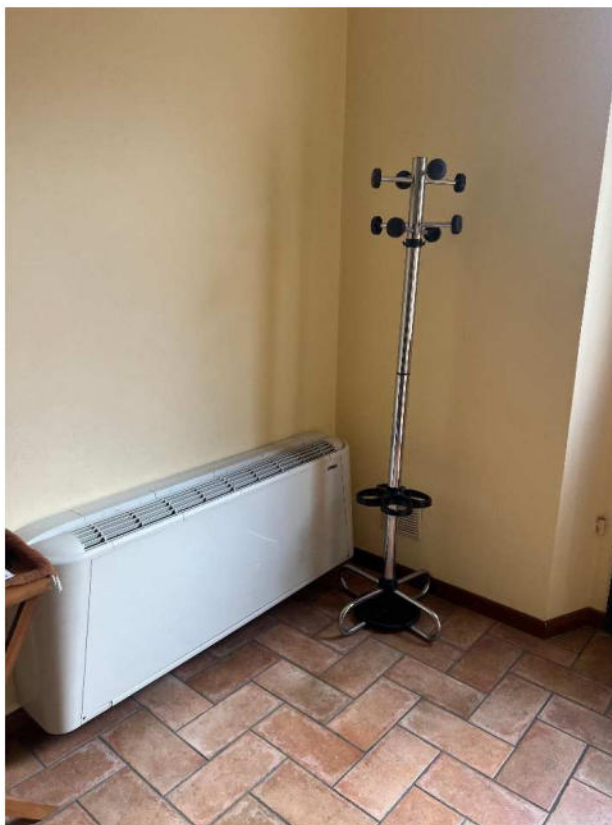
Lotto 3 –vista interna sala d’attesa