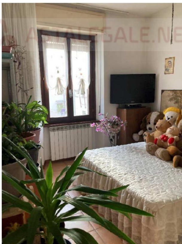
Lotto 1 – camera da letto