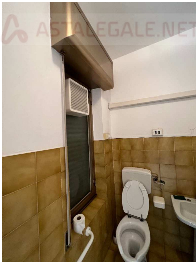
Lotto 3 –servizio igienico