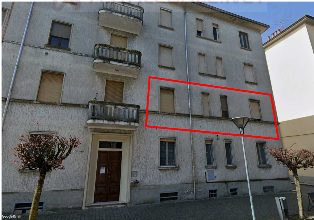
Lotto 1 – Vista da Via Marconi