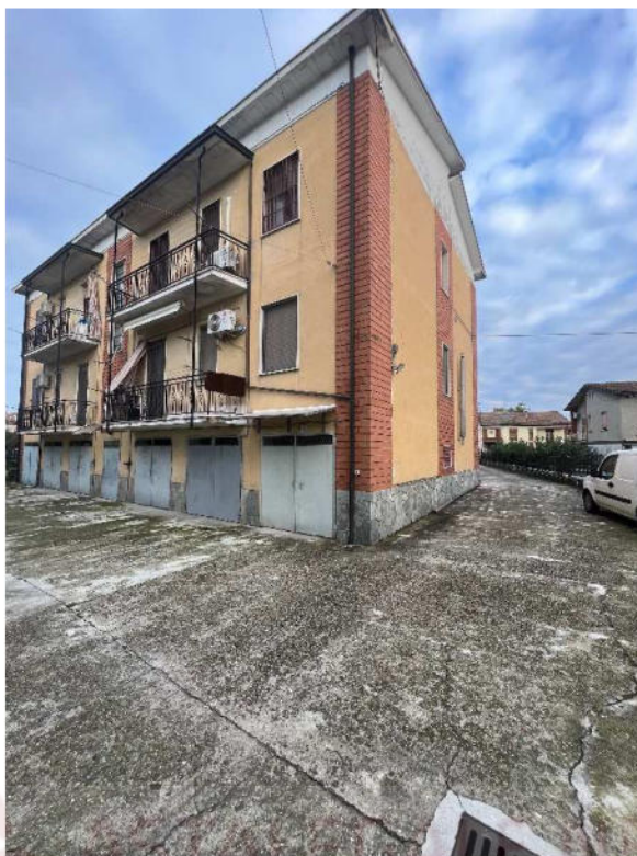
Lotto 4 –vista esterna