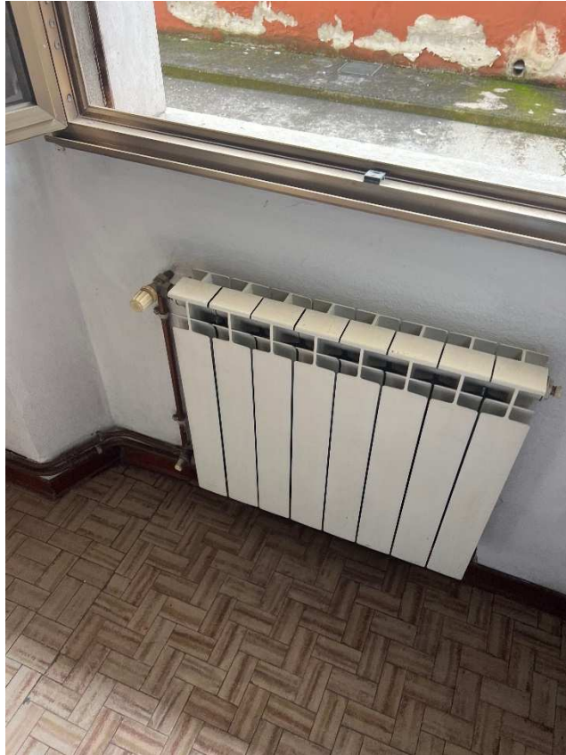
Lotto 2 –vista interna disimpegno