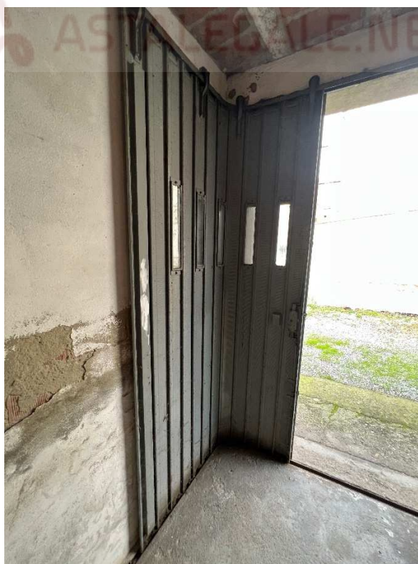
Lotto 1 – autorimessa