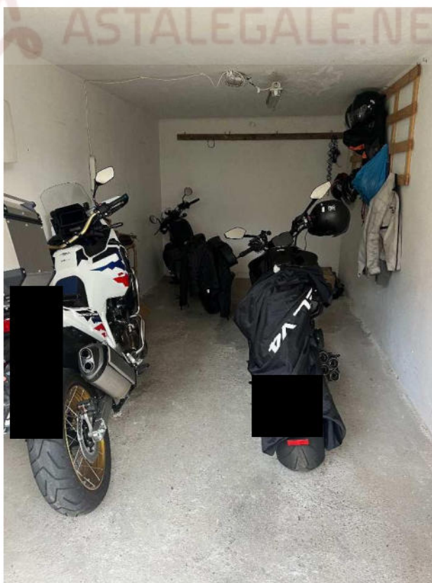
Lotto 4 –vista interna autorimessa