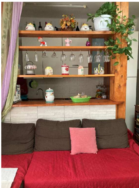
Lotto 1 – zona giorno