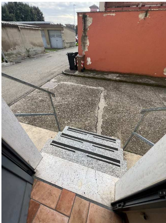
Lotto 3 –porta di ingresso