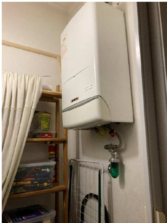
Lotto 1 – ripostiglio con caldaia