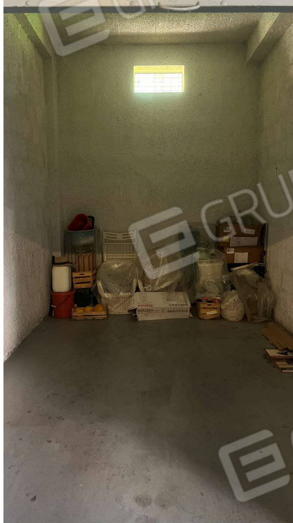
FOTO 10 - BOX AUTO