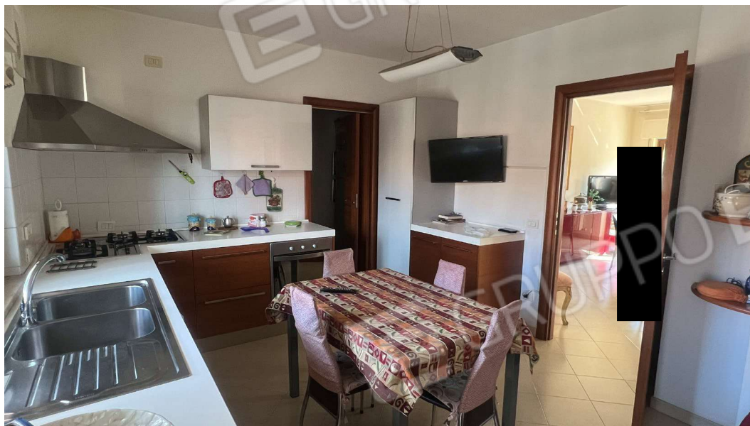
FOTO 3 - CUCINA