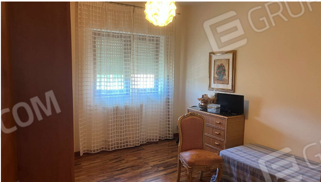
FOTO 6 - CAMERA DA LETTO