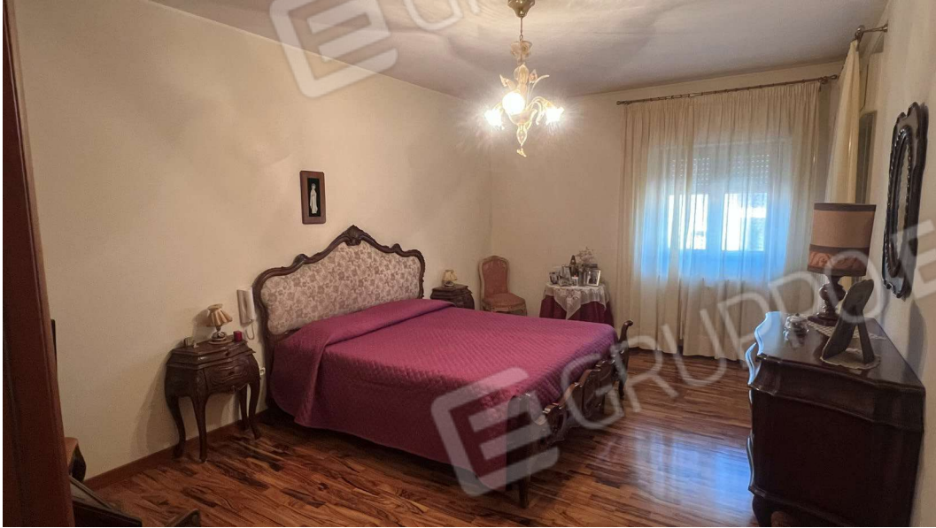
FOTO 5 - CAMERA DA LETTO