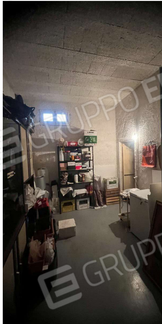
FOTO 8 E 9 - CANTINA