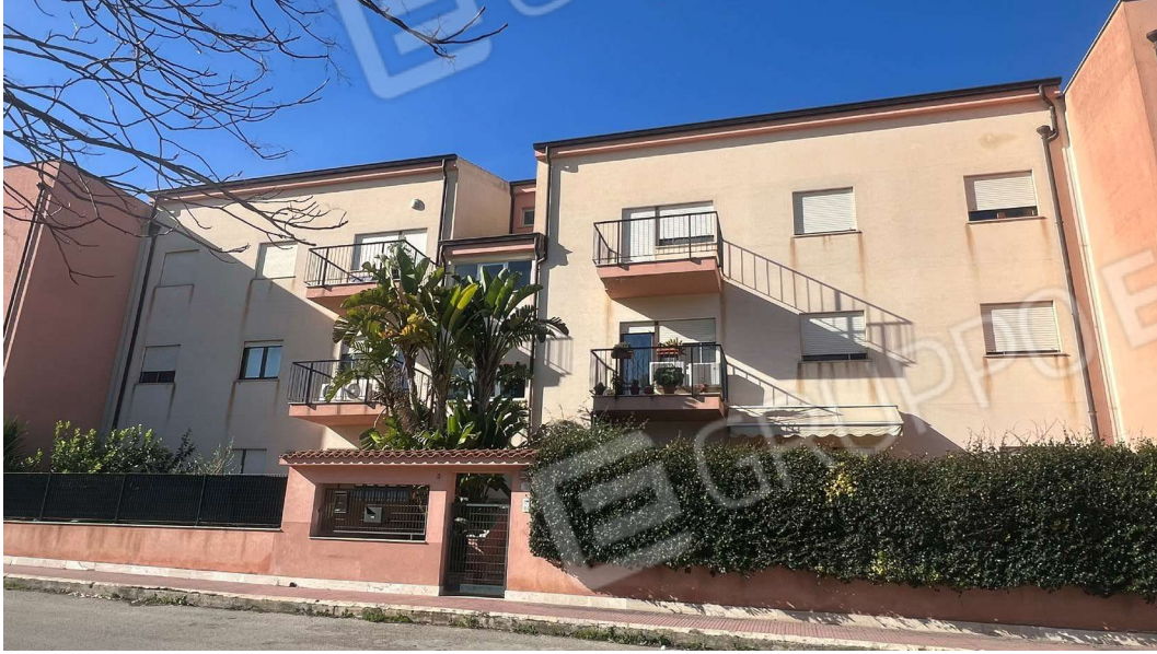
FOTO 1 - PROSPETTO VIA DON G. GIARDINA

BENE n.1: appartamento sito in Alcamo (TP), Via Don G. Giardina n.3 - piano 1