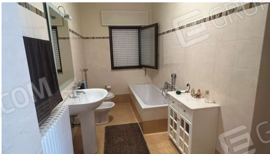
FOTO 4 - BAGNO