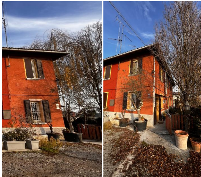
La porzione oggetto della procedura in colore arancione